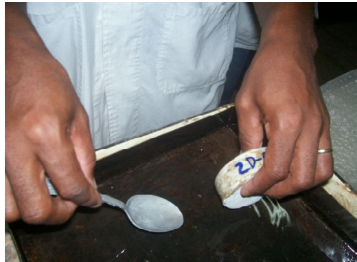
Fig. 1. Las probetas reciben tratamiento impermeable por los laterales con resina epoxi.

Las probetas se pesaron antes de ser puestas en contacto con el agua y después a intervalos de tiempo de 1; 2; 3; 4; 6; 24; 48; 72; 96, etc. Hasta que el peso se mantuvo constante.