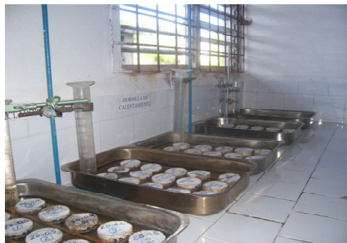
Fig. 3. Disposición de las probetas cilíndricas para el ensayo de absorción capilar.