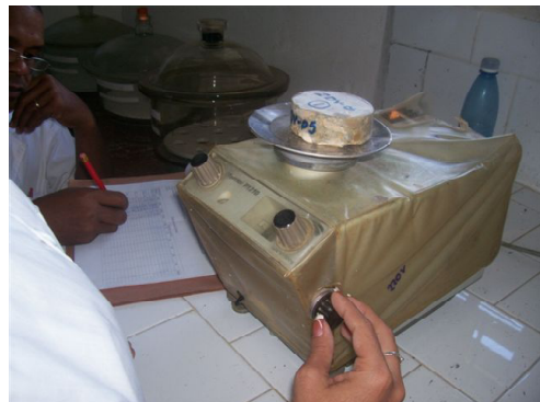
Fig. 2. Las probetas ya tratadas son pesadas antes de comenzar el ensayo de absorción.