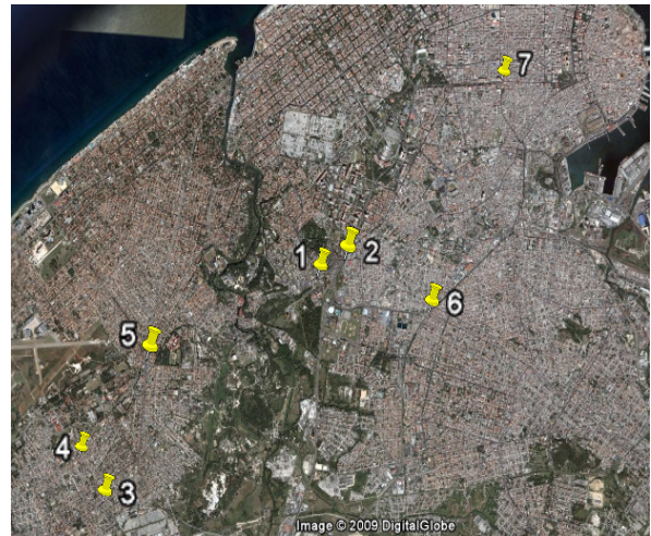
Fig. 1. Ubicación de las intersecciones tomadas para el estudio.

Todas presentan elevados volúmenes de tránsito y están ubicadas en zonas de la ciudad con características disímiles que permiten diversificar aspectos tales como: composición vehicular, conducta de usuarios, influencia de la zona geográfica y del centro comercial de la ciudad. La ubicación de cada una se presenta en la figura 1.