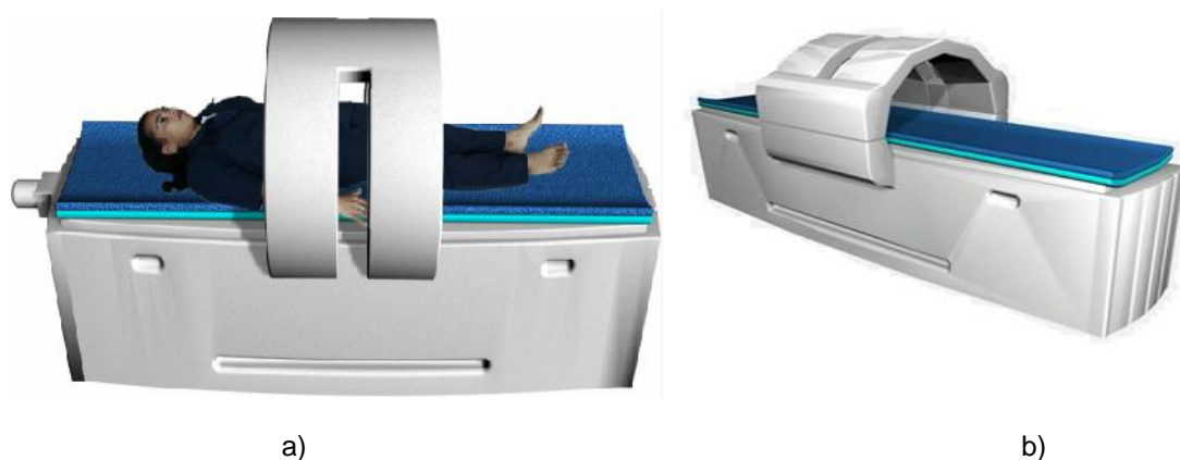
Fig. 3. Dispositivo magnético a imanes permanentes con accesorio del sistema magnético: a) estático y b) regulable

La inducción magnética del campo magnético es de 140 G en un volumen esférico de 0,2 m de radio. Además con los cálculos de los parámetros del dispositivo del desplazamiento lineal, el motoreductor paso a paso y el sistema regulable de apertura y cierre del sistema magnético se obtuvo el diseño que se muestra en la figura 3.